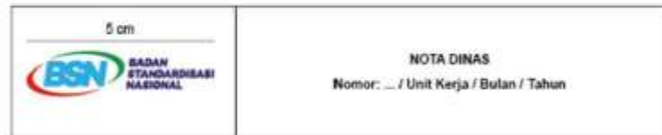
Gambar 2. Nota dinas