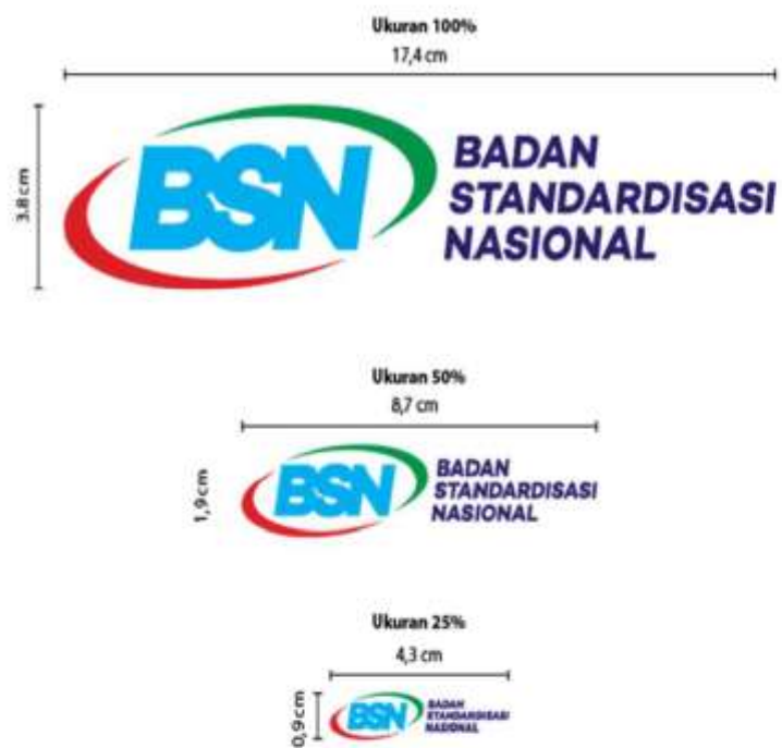
Gambar 5. Perbandingan Ukuran pada Logo