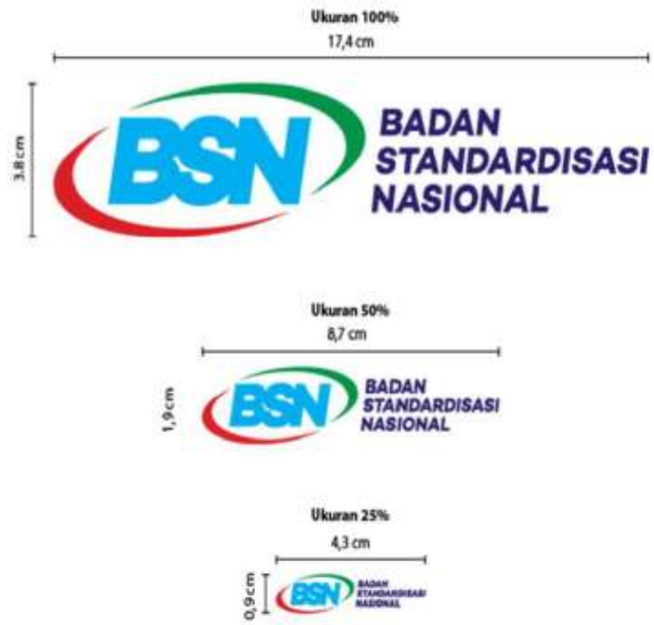
Gambar 5. Perbandingan Ukuran pada Logo