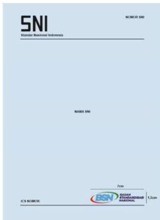
Gambar 6. Dokumen SNI