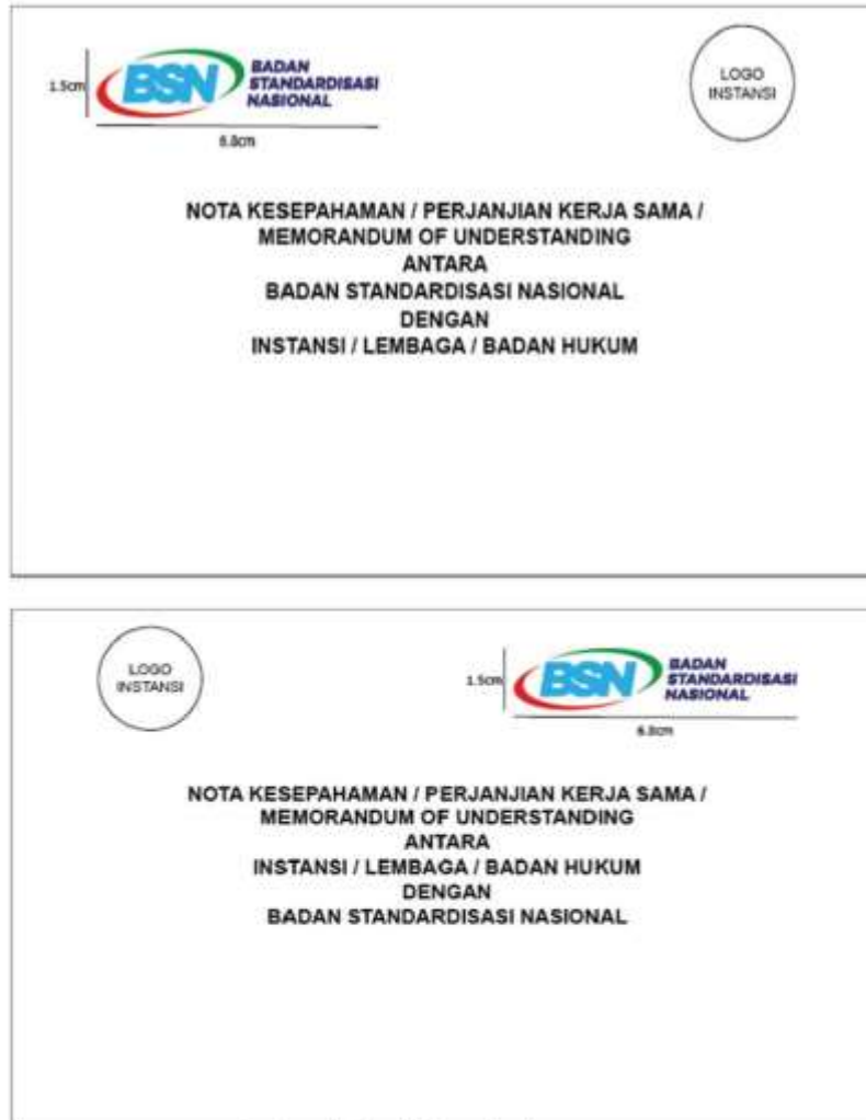
Gambar 7. Naskah perjanjian