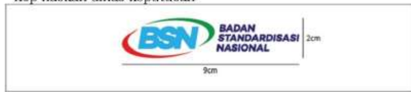
Keterangan gambar 1: Logo BSN berada di tengah dengan posisi rata kanan dan kiri