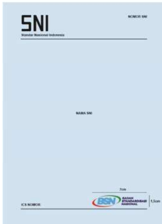
Gambar 6. Dokumen SNI