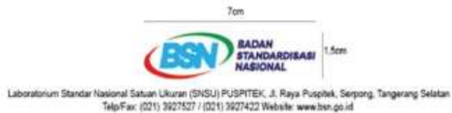
Gambar 4. Surat Dinas Alamat Serpong