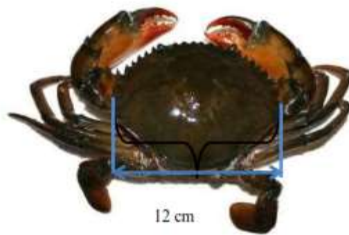
Gambar Pengukuran Karapas Kepiting