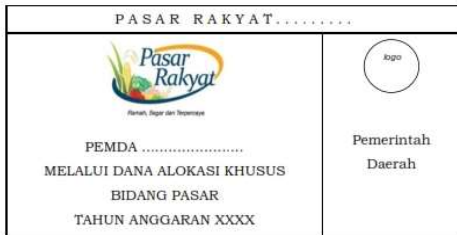
Gambar 3. Tata Desain Papan Nama Pasar Rakyat