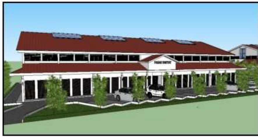
Gambar 2. Contoh Bangunan Pasar Rakyat Tampak Depan